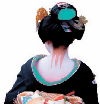
「カラーデザイン公式ガイド[感性編] supported by Pantone」より