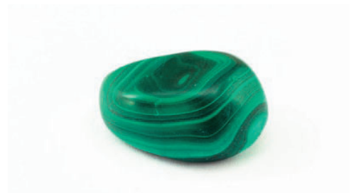
「カラーデザイン公式ガイド[感性編] supported by Pantone」より

②合成染料による明るい緑みの青で、明治末から大正時代にかけて芸者衆の間で大流行した色。